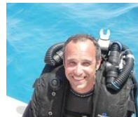
9h20 Salle de conférence

Conférences des « grands témoins » pour le développement durable